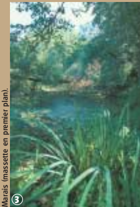
Marais (massette en premier plan).

La Chasse Napoléon est une majestueuse allée de peupliers de plus de 20 mètres de haut. Les adjectifs ne manquent pas pour qualifier cette voie royale, empruntée par les trou-