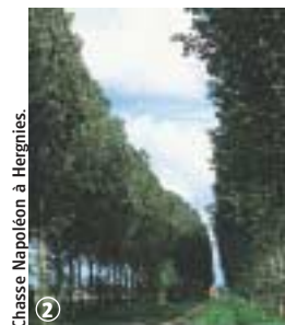
Chasse Napoléon à Hergnies.